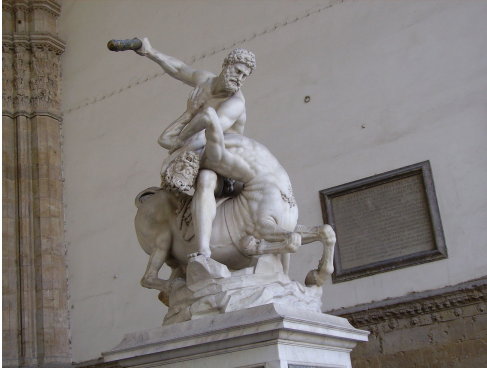
Giambologna: Herkules und der Zentaur, 1600, Marmor 2,69 m, Loggia dei Lanzi, Florenz https://skfb.ly/6R7An