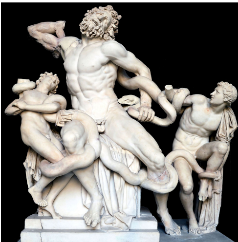
Hagesandros, Athanadoros, und Polydoros: Laokoon Gruppe, ca. 100 n.Chr. Marmor, 1,84 m

Du findest ein 3D Modell der jeweiligen Plastik, wenn du den QR-Code nutzt.